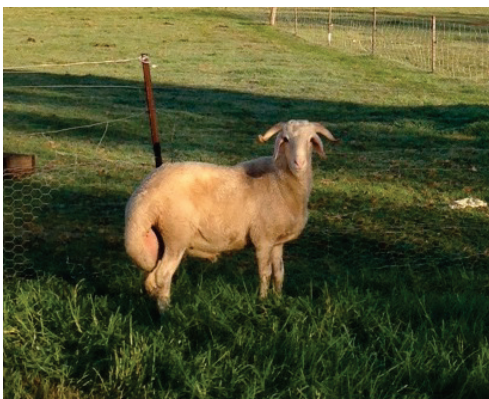
Fettschwanz eines Schafes, hebr. אֵלֶּיָהּ

Widder der Einsetzung: Durch diesen Widder wurden Aharon und seine Söhne in die Kehuna eingesetzt.